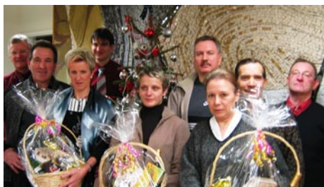
Les gagnantes du tirage au sort, entourées de l'équipe d'Obernai Habitat

Simple et économique : le prélèvement automatique ! Depuis sa mise en place il y a tout juste un an, plus de 65 % des locataires d'Obernai Habitat ont opté pour ce mode de règlement.